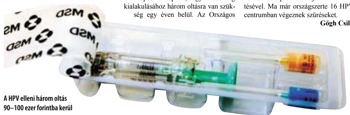
A HPV elleni három oltás 90–100 ezer forintba kerül